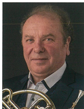
ホルン ジャック・デルプランク フランス国立トゥールーズ・ キャピトル管弦楽団首席 パリ国立高等音楽院教授