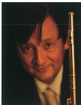
フルート トーマ・プレヴォ フランス国立放送フィル首席 パリエコールノルマル音楽院教授

お申し込み 公益財団法人特別史跡旧閑谷学校顕彰保存会 閑谷の夏音楽体感プログラム係り お問い合わせ 〒705-0036 岡山県備前市閑谷784 電話 0869-67-1427 メール info@shizutani.jp