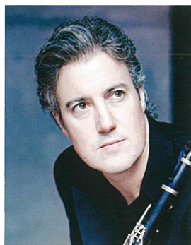
クラリネット パトリック・メッシーナ フランス国立管弦楽団首席 ロンドン王立音楽院客員教授 パリエコールノルマル音楽院教授