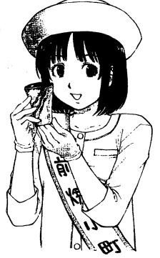
第13回 岡山県芸術文化賞 功労賞受賞 本誌備前焼漫画「ハルカの陶」 ©西崎泰正・デイスク・ふらい／芳文社

2015年 期日 10月17日(土) 9:00~17:30・18日(日) 9:00~16:30 会場 岡山県備前市 備前焼伝統産業会館 及び 伊部地区 JR赤穂線伊部駅周辺